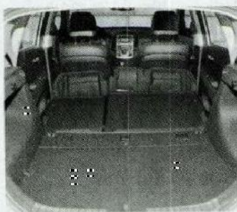
Capacité jusqu'à 1250 dm 3 .