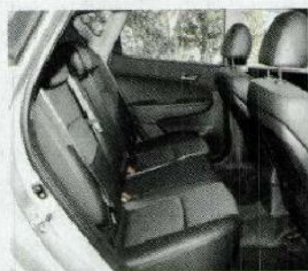
Confort aux places arrière.