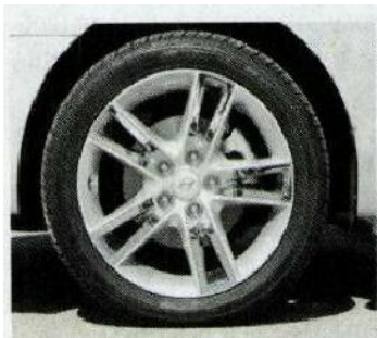
Au menu, des jantes chromées.