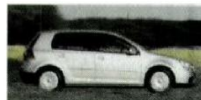
VW Golf 2.0 FSI