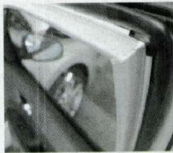
Soudures un poil trop visibles.